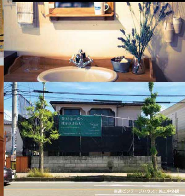
東通ビンテージハウス：施工中外観